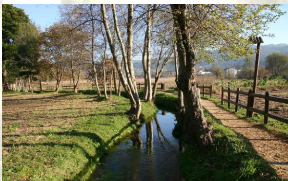
Ruta dos Muíños

Pola mañá, propoñemos percorrer a parte inicial da “Ruta da pedra e da auga”, tamén chamada “Ruta dos muíños de Barrantes”. Este percorrido, de algo máis dun quilómetro, constitúe unha senda de gran beleza e cun gran valor etnográfico, debido á presenza de innumerables muíños de auga a carón do río Rande. A ruta completa consta de 7 quilómetros, ata rematar no mosteiro da Armenteira, no municipio veciño de Meis.