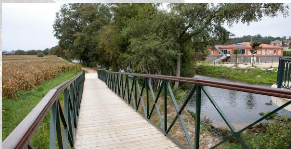
Paseo Fluvial ó seu paso por Cabanelas

quilómetros, cinco dos cales transcorren paralelos ao río Umia, por unha paraxe de ribeira de gran beleza. A medio camiño, a senda cruza a ponte de Cabanelas, en cuxo entorno hai unha área recreativa., e chega á ponte de Barrantes, onde, no entorno de outra área recreativa, o camiño abandona a ribeira do Umia para seguir pola beira dun dos seus afluentes: o Armenteira ou Rande. Finalmente, a ruta remata no lugar de Os Castaños, nas inmediacións da oficina de turismo, onde enlaza con outra importante senda, a “ruta da pedra e da auga” .