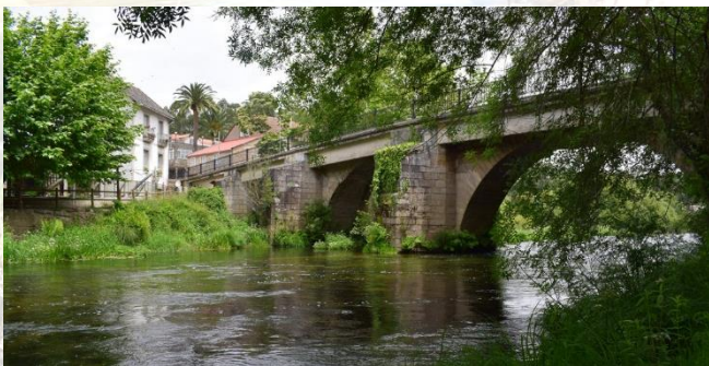
Ponte dos padriños

Un dos atractivos de Ribadumia, sen dúbida, está nas súas sendas fluviais. Máis de dez quilómetros de sendas nun entorno privilexiado e dunha gran beleza paisaxística, acompañados de muíños, lavadoiros e fontes, que aportan unha importante riqueza etnográfica.